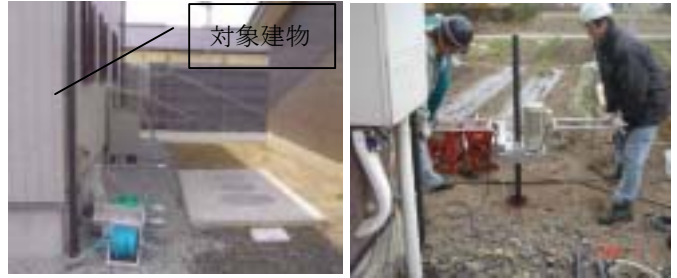
写真-3 建物と浄化槽の配置