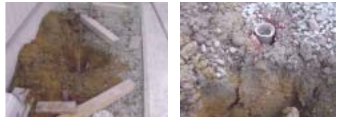
写真-5 パイプ打設 (左) とパイプ抑止効果状況 (右)