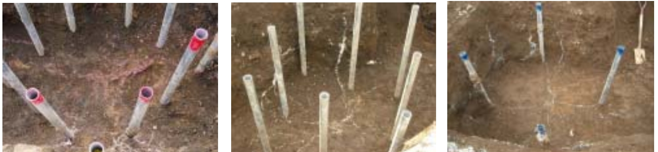
写真-2 注入固化体の割裂脈 (左：パイプ@300, 中：パイプ@450, 右：パイプ@900) (代表深度 1.0m)