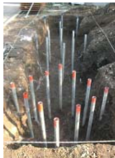
写真-1 注入固化体の掘出調査状況